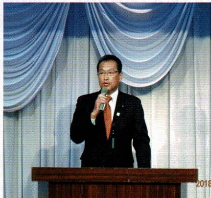
挨拶される石井邦一県議会議員