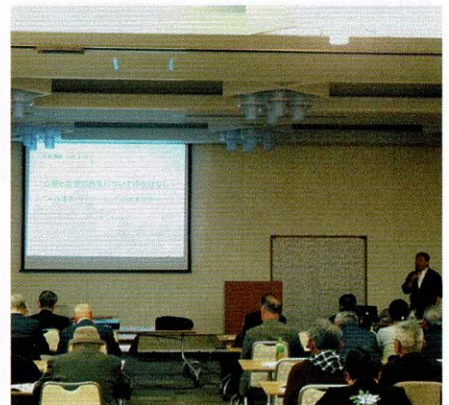
秋島医師による講演