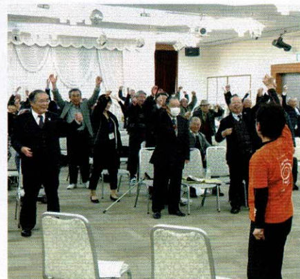
笑いヨガの実演・体験