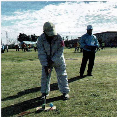
グラウンドゴルフを楽しむ

スポーツを通して、会員相互の親睦を図っています。今後とも会員同士の繋がりを深めつつ、会員の加入に力を入れていきたいと思えます。