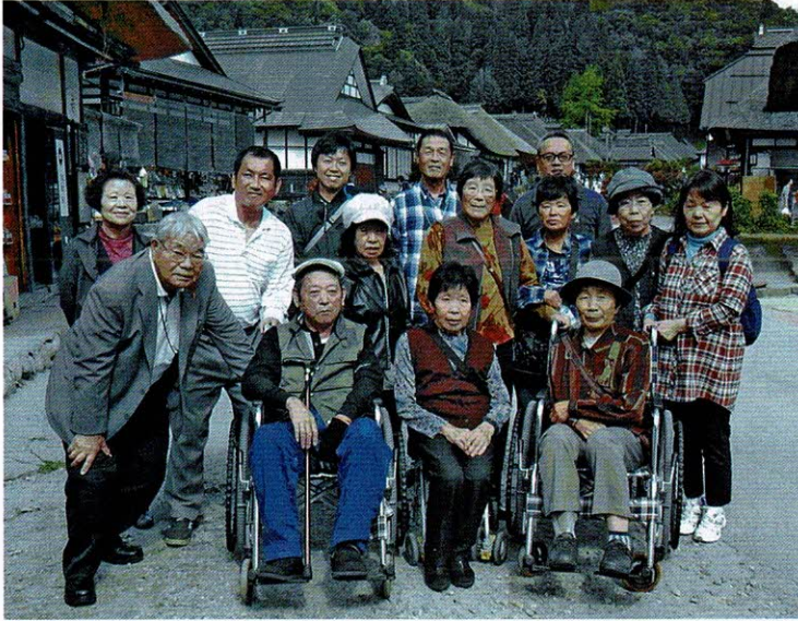
宿場町の面影が残る大内宿にて

今年度の県外研修旅行は、春の総会で福島の大内宿」との希望が多く、一昨年に続いて、福島への旅となりました。 二本松の菊人形や会津西街道として栄え、下野街道の宿場町であった茅葺き屋根の「大内宿」。過去にタイムスリップしたかのような風景に心癒され、福島の魅力を満喫した二日間となりました。