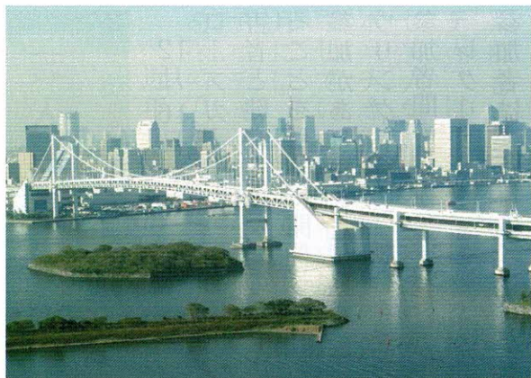
「はちたま」から臨海副都心を望む