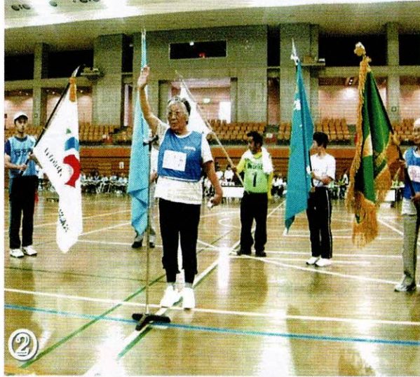
開催地代表による選手宣誓

7月14日(土) かしまスポーツセンターで鹿行地区身体障害者スポーツ大会が開催され、参加者から以下のような感想がよせられました。 ・若返った様で楽しかった ・皆さんの笑顔で癒された ・初めて参加したが、楽しく出来た ・他の地区の人とも仲良くなれた等です。