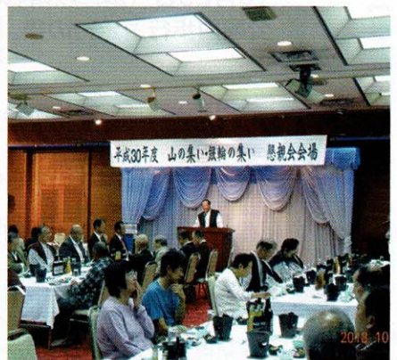
主催者挨拶をする高木会長