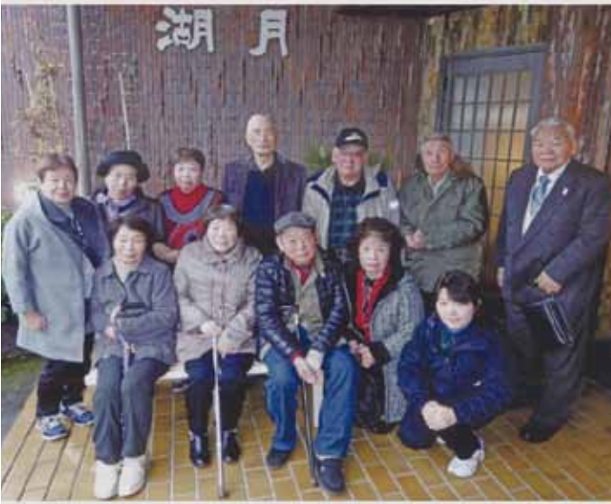
新年会にて (令和2年1月23日) 2年6月18日発行号

新年会を行方市「湖月」にて行いました。今回は、会員の親睦を深めたいとの思いで会員だけで開催しました。霞ヶ浦の湖面を泳ぐ水鳥に目をやり、こんな近くで湖を眺めることもなかなかないと思いつながら、皆さんとの話も弾み、いつの間にか会食の時間が過ぎました。