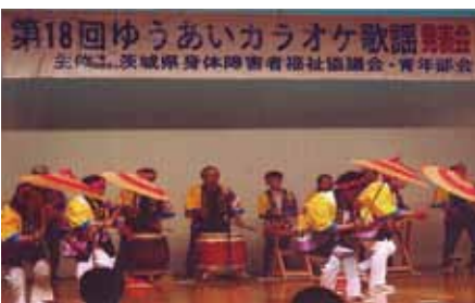
寺久八木節保存会(坂東市)による演奏

平成27年から最近5年間のカラオケ大会で歌われた歌謡曲ベストテンを紹介いたします。