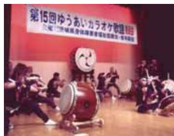
鹿島灘太鼓による太鼓演奏