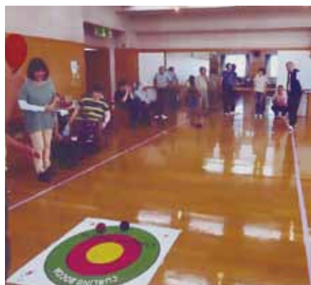
カーリングボッチャ (2018)