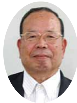
一般社団法人 茨城県身体障害者福祉協議会