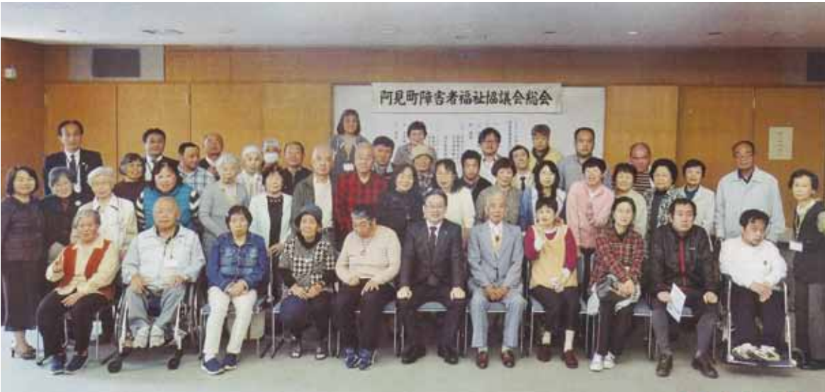
昨年度総会にて (4月21日) 2年6月発行号