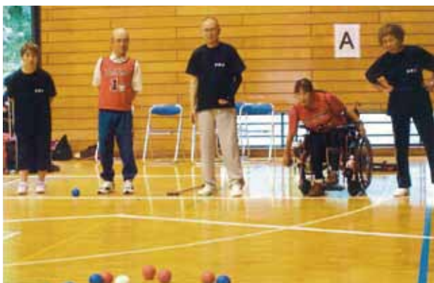
第1回稲敷市ポッチャ大会の様子