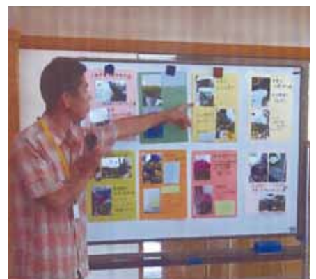
発表「花を通じ得た心」(2015)