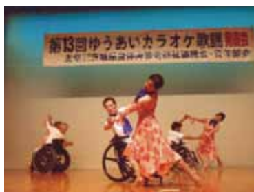
車いすダンス研究会クアルトによる演技