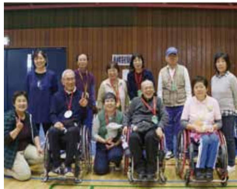
笠間市ふれあいスポーツの集いにて

つ、今後も会員相互の心の拠りどころとなるような会を目指していきたいと思っています。