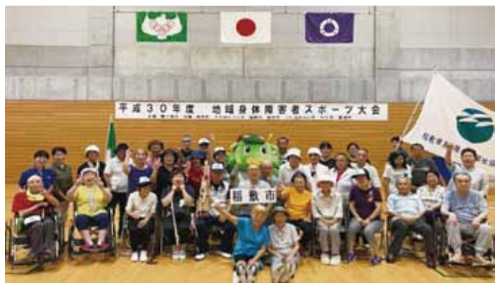
県南地区スポーツ大会にて

現在は新型コロナウイルスの影響により、当協議会においても様々なイベントが中止を余儀なくされていますが、会員の健康を第一に、この難局を乗り越えられるよう努めて参ります。