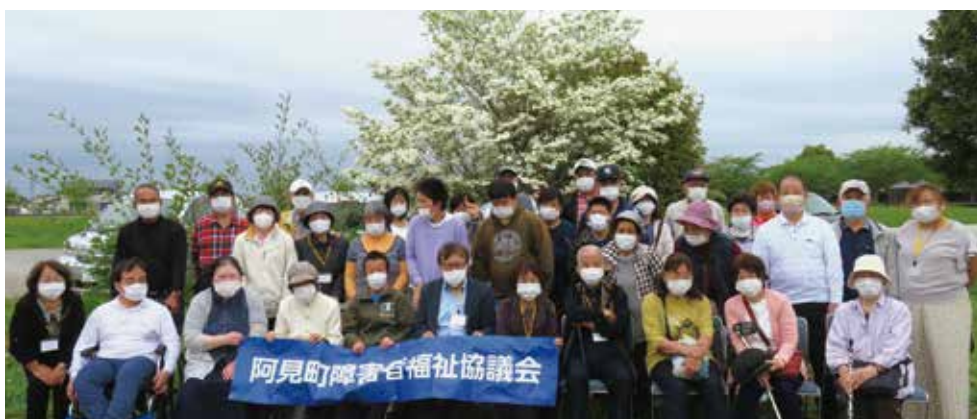
八重桜を観る会（令和4年4月）