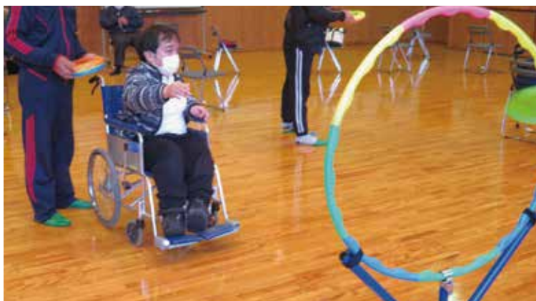
「けんこう広場」活動の様子

コロナ禍において、例年通りの行事がなかなか出来ない状況ではありますが、工夫をこらしながら事業活動に取り組んでいます。