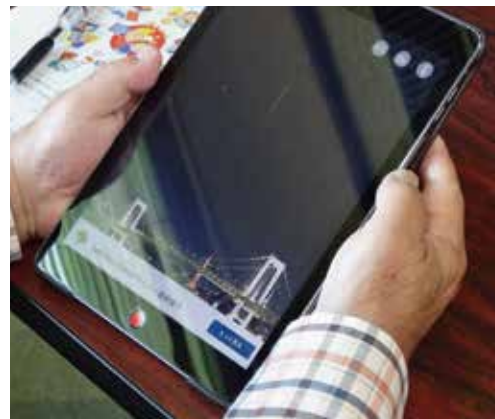
研修会使用タブレット