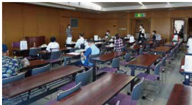
日曜交流会の様子