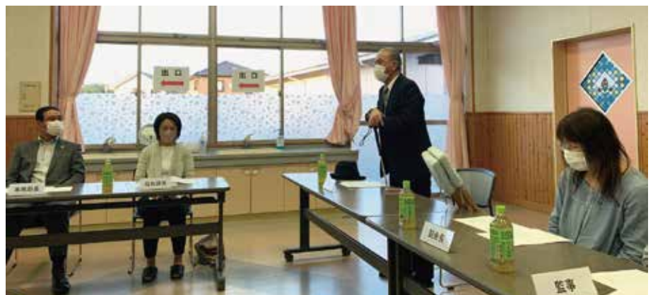
総会の様子(会長あいさつ)

まだまだ会員は少なく、またコロナ禍ということもありませんが、若い世代から高齢の世代まで同じ悩みを持つ者同士が寄り添い、助け合えるようなきっかけを作れる団体を目指したいと思います。