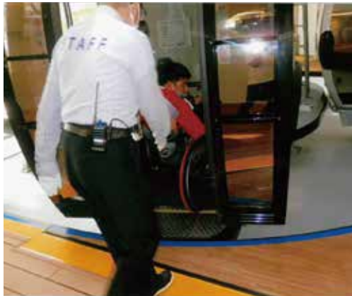
エア・キャビンへの乗車(横浜)

以前のように何の心配もなく、多勢の中で心の中から喜びを表現でき、楽しむことができる日が戻