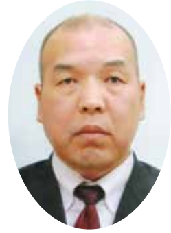
茨城県福祉部障害福祉課長