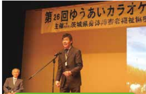
村上青年部会長あいさつ