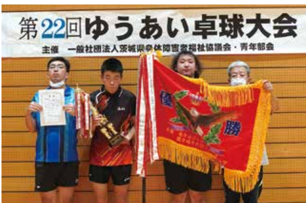
団体戦優勝チーム (ゆうあい北茨城)