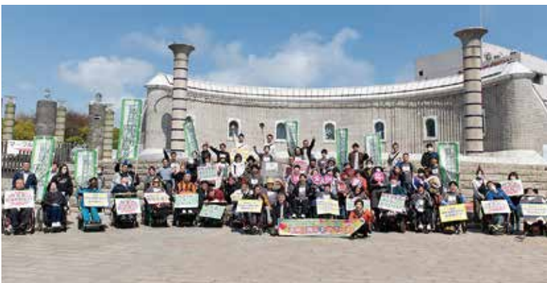
パレード出発前の集合写真

令和5年5月13日・14日・20日・27日・28日に、笠松運動公園他2会場で、令和5年度茨城県障害者スポーツ大会(個人競技の部)が開催されました。陸上競技や水泳など合計8つの競技が行われ、県内各地から多くの選手、役員、ボランティアの方々に参加されました。