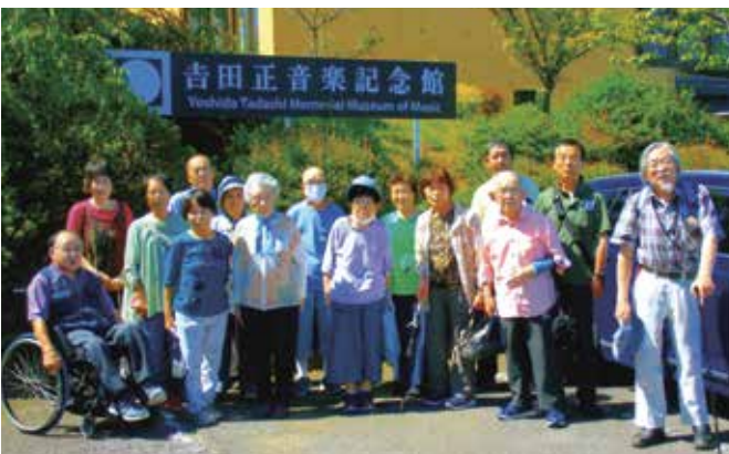
吉田正音楽記念館(日立市)にて

天候にも恵まれ、2ヶ所の見学地に満足。バスの中では、クイズ、脳トレ、特にカラオケにいたっては、誰が歌っても合格の鐘が鳴り拍手喝采、楽しい日帰りの旅は、感謝の一日となりました。